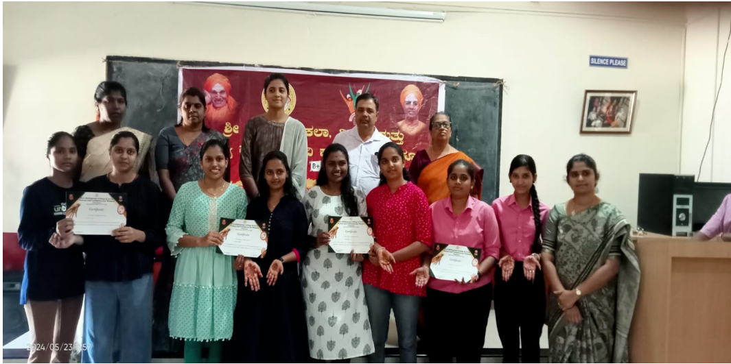
Certificate were issued to the students