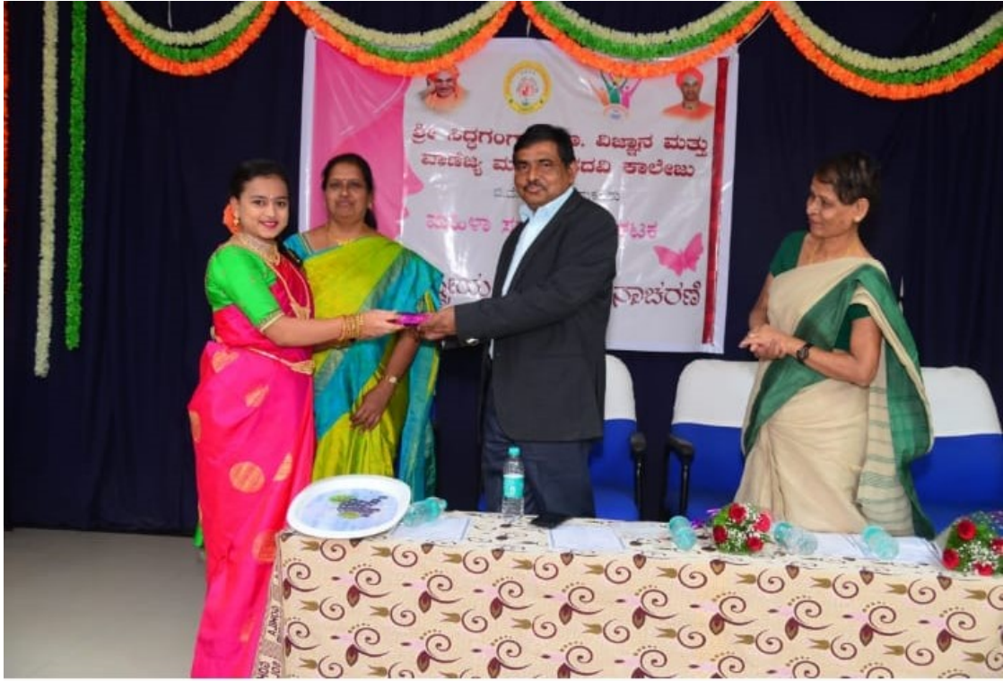
Prize distribution for winners